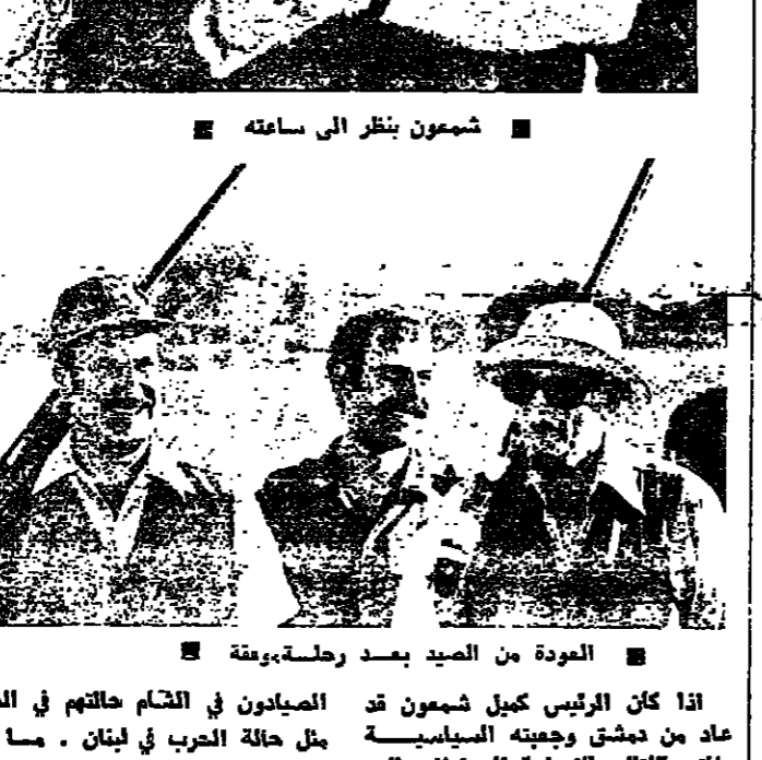
المودة من الصيد بعد رحلة بوفقة